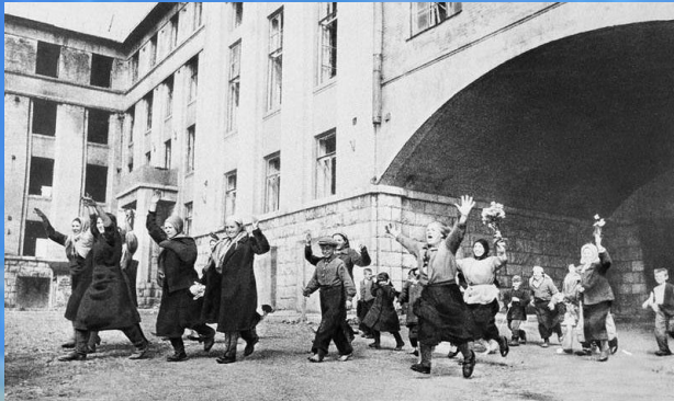
Они кричали тогда «ПОБЕДА!», но воинство продолжается поныне.