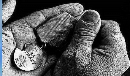
История в ладонях.

Мы все умрем, людей бессмертных нет, И это все известно и не ново. Но мы живем, чтобы оставить след: Дом иль тропинку, дерево иль слово.